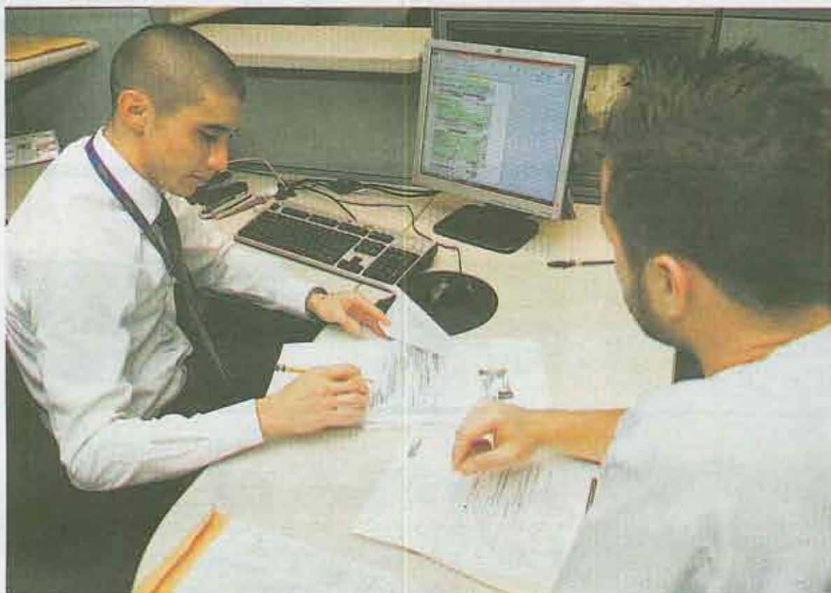
Los bancos públicos han empezado a motivar a sus clientes a obtener créditos en colones. Esto ha provocado que, desde finales del 2013, las colocaciones en dólares hayan crecido menos. MARIO ROLÍAS

"En el Banco Nacional, los créditos otorgados en dólares a no generadores de ingresos en dólares han sido sensibilizados de forma que puedan soportar alzas en el tipo de cambio importantes, por lo que, a corto plazo y con una alza relativa del 6%, no vislumbramos problemas de capacidad de pago",